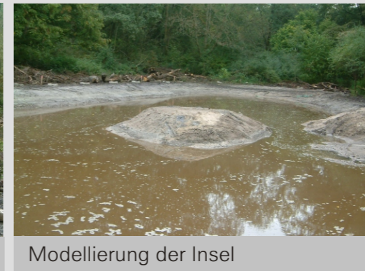
Modellierung der Insel