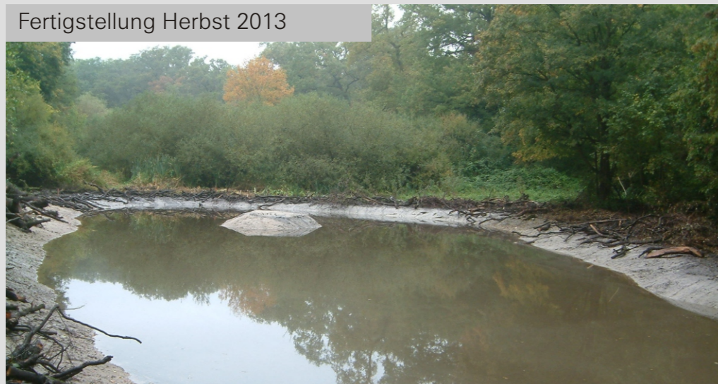
Fertigstellung Herbst 2013