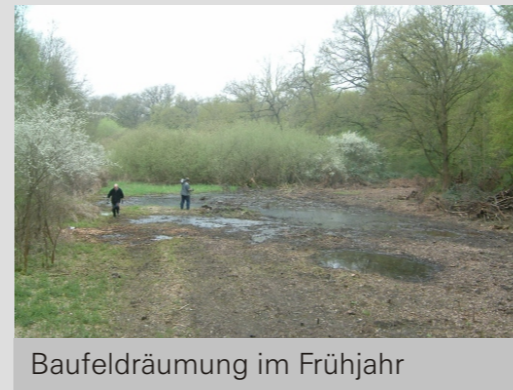
Baufeldräumung im Frühjahr