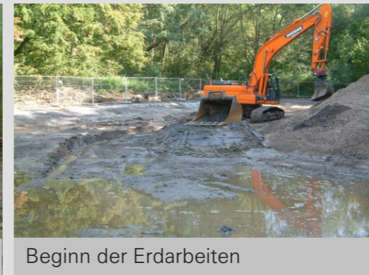
Beginn der Erdarbeiten