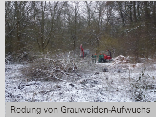
Rodung von Grauweiden-Aufwuchs